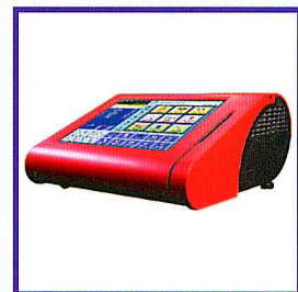
Gehäusefarben: Schwarz, Rot, Blau